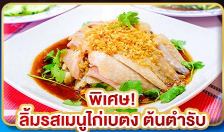
พิเศษ! ลิ้มรสเมนูไก่เบตง ดั้นคำริบ