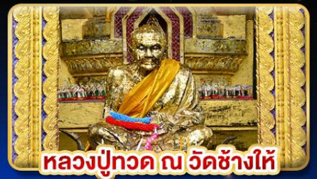
หลวงปู่ทวด ณ วัดช้างให้