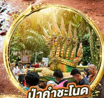
ป่าคำชะโนด