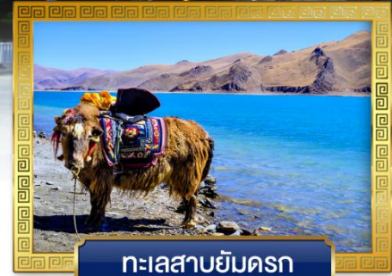
ทะเลสาบยัมดรก

เดินทางโดย: สายการบินลัคกี้แอร์ & ไซน่าอีสเทิร์นแอร์ไลน์