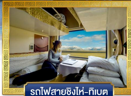
รถไฟสายชิงไห่-ทิเบต