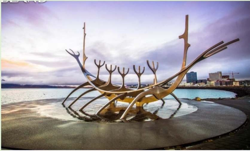
ลักษณะเหมือนเรือไวคิง

ไม่ไกลกันให้ท่านแวะถ่ายรูปกับ ประติมากรรม เดอะซัน voyager (Sun Voyager) ที่ผู้สร้างตีความหมายว่าเป็น เรือ แห่งความฝัน โดยตัวประติมากรรมจะเป็น